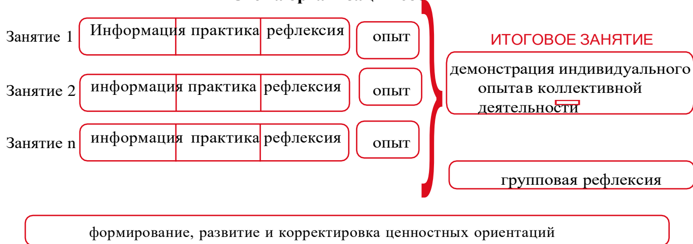
Рисунок 1 – Схема организации события

Таким образом, у пятиклассников происходит построение логической цепочки от собственного опыта проживания каждого занятия к ознакомлению с опытом других детей и к формированию общего отношения классного коллектива к прожитому ими событию.