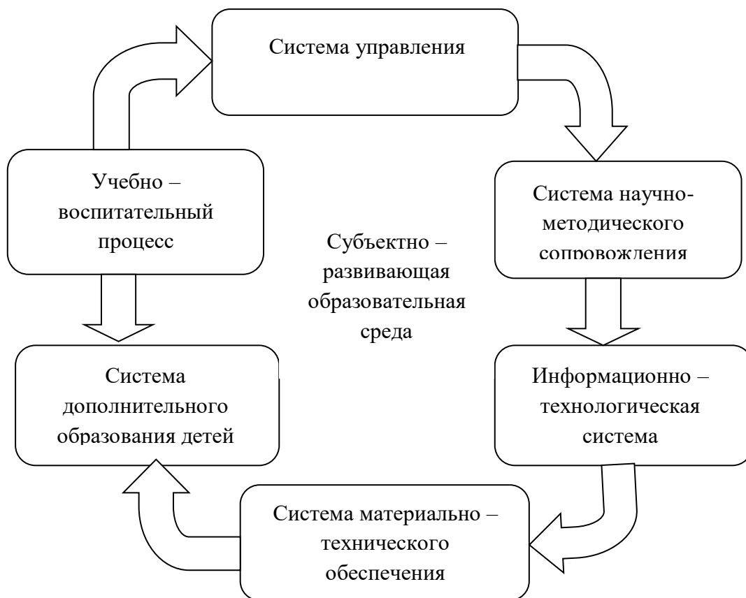
Содержательные аспекты изменений

Образовательная среда составляет диалектическое единство своих пространственно-предметных и социальных компонентов, тесно связанных между собой и взаимообусловленных. В образовательной среде каждый субъект образовательного процесса осуществляет свою деятельность, используя пространственно-предметные элементы этой среды в контексте сложившихся социальных отношений. Таким образом, качество образовательной среды определяется как качеством пространственно-предметного содержания данной среды, так и качеством социальных отношений в данной среде, а также качеством связей между пространственно-предметным и социальным компонентами этой среды.